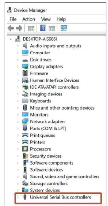
Universal Serial Bus controllers